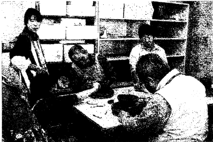
真剣に力作を上げています

色付けをし、焼き上げられた作品がついに先日届きました。とても素晴らしい作品に仕上がっています。 この号が発行される頃には力作が参加された皆さんのお手元に届いている予定です。 陶芸を楽しんだ後は、ヘルシーな昼ご飯をいただきながら、黒田先生を囲んで普段の診療時間には聞けない質問をしたり、黒田先生から『糖尿病治療にお