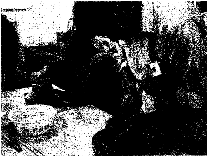
陶芸教室のようす

グループの講師の方が各テーブルについて下さり指導を受けながら自分から作りたいものをイメージして、真剣に作成していました。